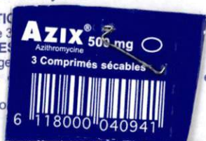
TABLEAU A (LISTE I).

Azix peut être pris pendant ou en dehors des repas.