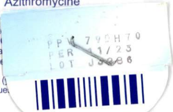
TABLEAU A (LISTE I).

Azix peut être pris pendant ou en dehors des repas.