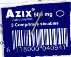
TABLEAU A (LISTE I).

Azix peut être pris pendant ou en dehors des repas.