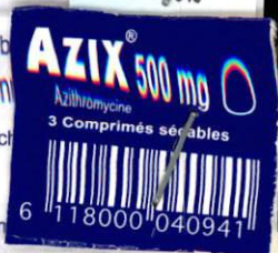
TABLEAU A (LISTE I).

Azix peut être pris pendant ou en dehors des repas.