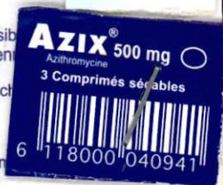
TABLEAU A (LISTE I).

Azix peut être pris pendant ou en dehors des repas.