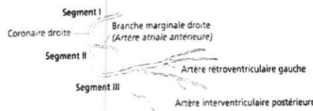
L'artère coronaire droite (réseau coronaire droit).

Réseau coronaire athéromateux et très calcifié avec des lésions tritornculaires sévères :